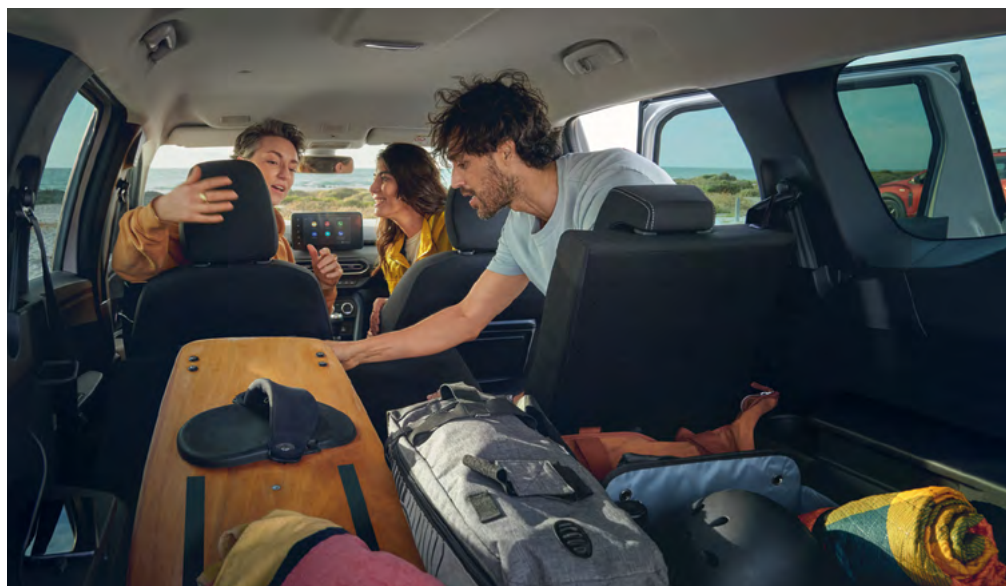
קיבולת מרבית של אזור המטען בדצימטר מעוקב בהתאם לתקן VDA (2,094 ליטר).