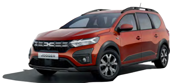
חום אדמה מטאלי (CNZ)