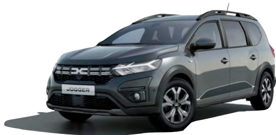
אפור מטאלי (KNA)