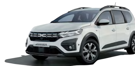
לבן קרח (369)