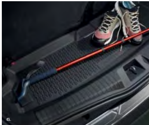
5. מסיטי רוח