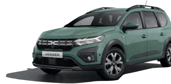
ירוק חאקי מט מיוחד (KQM)