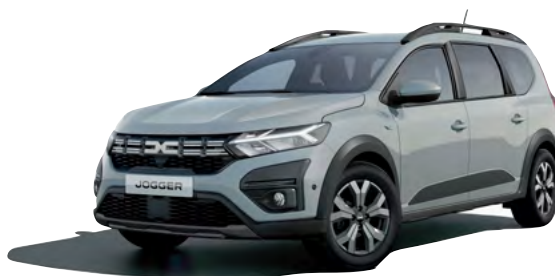
כסף מטאלי (KQF)