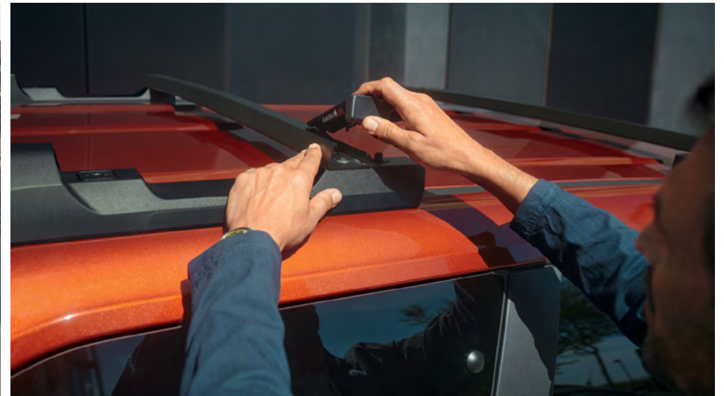
קורות גג מודולריות