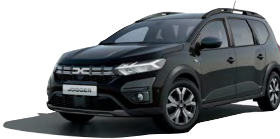
שחור פנינה מטאלי (676)