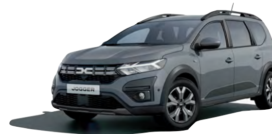
אפור אורבני מט מיוחד (KPW)