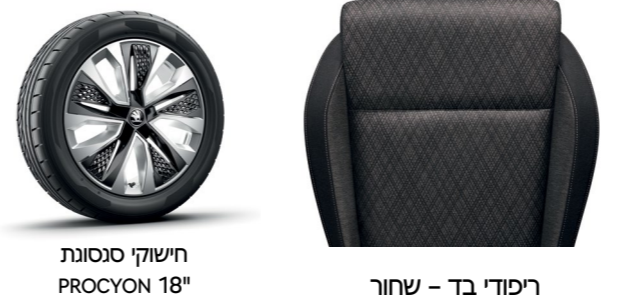
חישוקי סנסונג PROCYON 18"