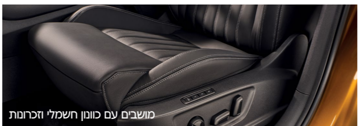
מושבים עם כונון חשמלי וזכרונות