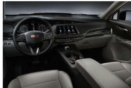
עור אפור בהיר