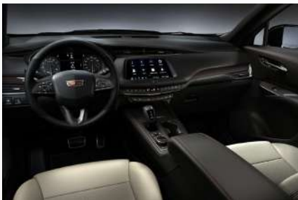
עור בצבע חיטה עם תפרים אדומים - דגם SPORT