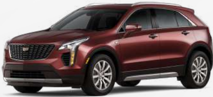
בורדו מטאלי | GCK