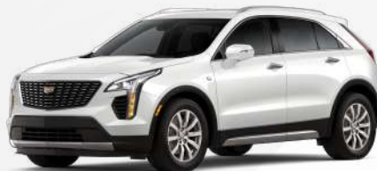
לבן קריסטל | G1W *צבע בתוספת תשלום