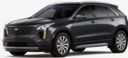
אפור כהה מטאלי | G6M