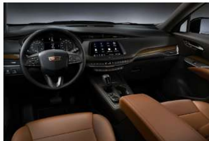
עור בצבע חום אדמדם - SEDONA