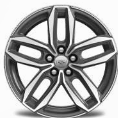
חישוקי אלומיניום 20" SPORT