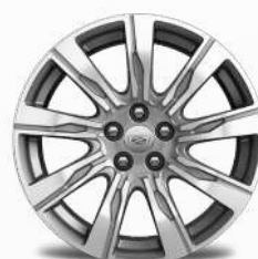
חישוקי אלומיניום 20" PREMIUM / PREMIUM LUXURY