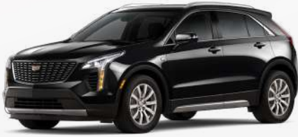
שחור כוכב מטאלי | G88