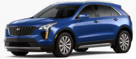
כחול מטאלי | GKK