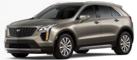
בד' מטאלי | G5D