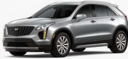
אפור סטרלינג מטאלי | GXD