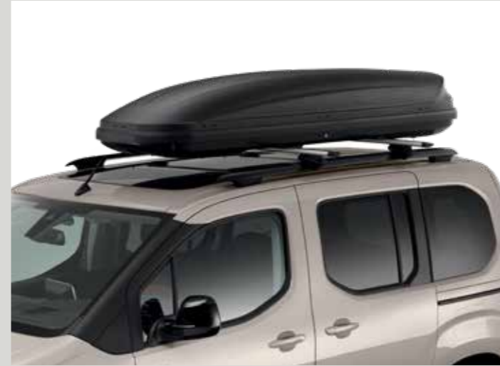
תא אחסון עילי קשיח 430 ל' THULE (נדרשים מוטות רוחב)