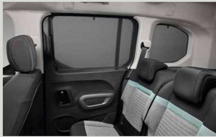
סט צלוני שמש לחלונות אחוריים (2 חלקים)