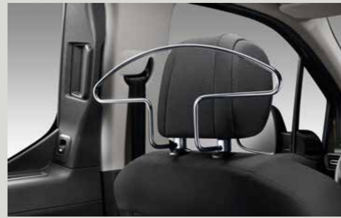
זוג קולבים למשענת ראש