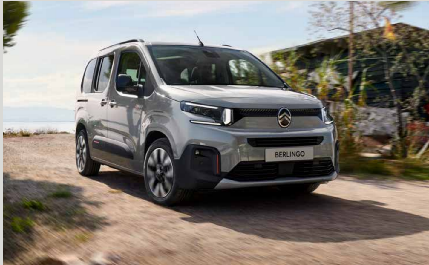
התמונה להמחשה בלבד. ט.ל.ח.