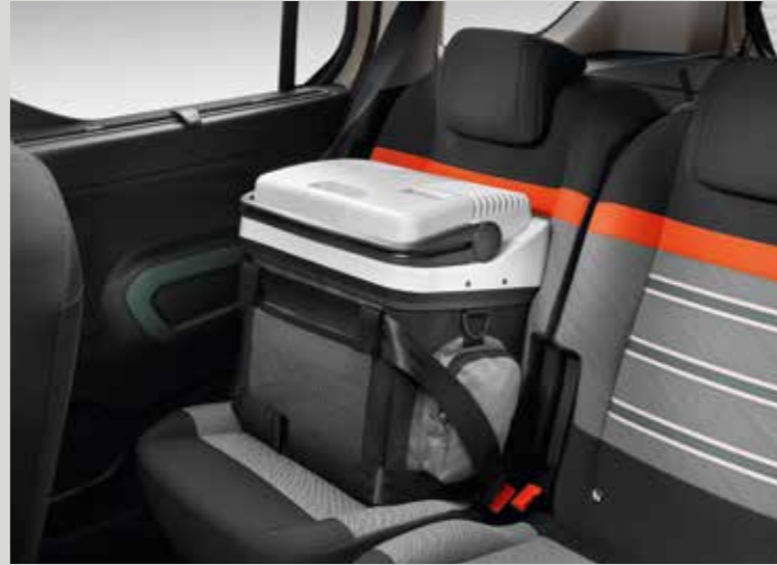
קירורית ביידת 20 ליטר, חיבור למצת הרכב 12 וולט