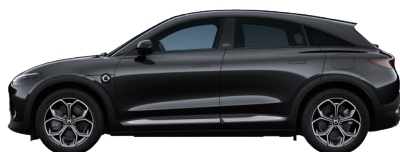
Meta Black Metallic