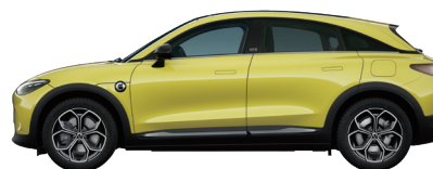
Lumen Yellow Solid