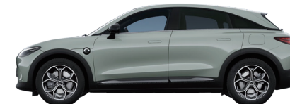
Future Green Metallic