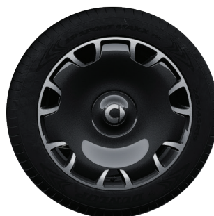
25th Anniversary Edition