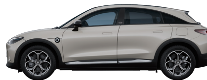
Ceramic Cream Solid