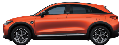
Photon Orange Metallic