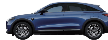
Quantum Blue Metallic