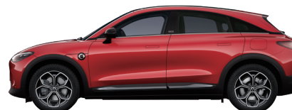
Leaser Red Metallic