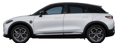
Digital White Metallic