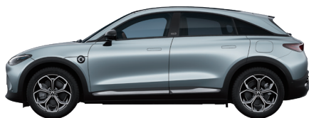
Electron Blue Matte