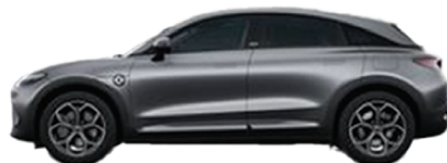
Atom Grey Matte