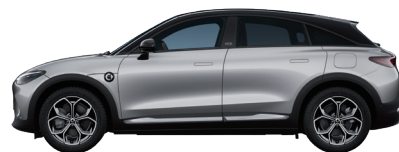
Cyber Silver Metallic