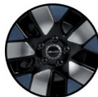
חישוקי סגסוגת אלומיניום בשילוב שלושה צבעים