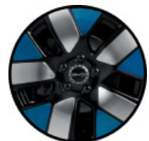
חישוקי סגסוגת אלומיניום בשילוב שלושה צבעים