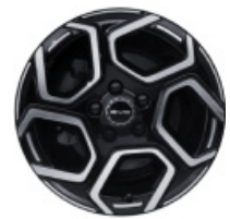
חישוקי סגסוגת אלומיניום בשילוב שני צבעים