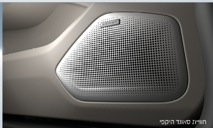
חוויית סאונד היקפי