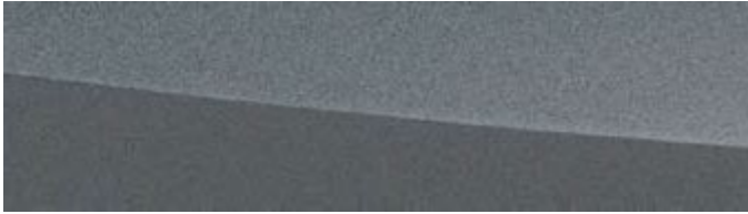
SONIC PLATINUM | 1L2