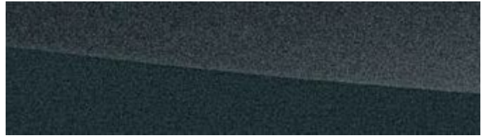
SONIC GREY | 1L1