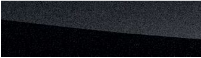
GRAPHITE BLACK | 223