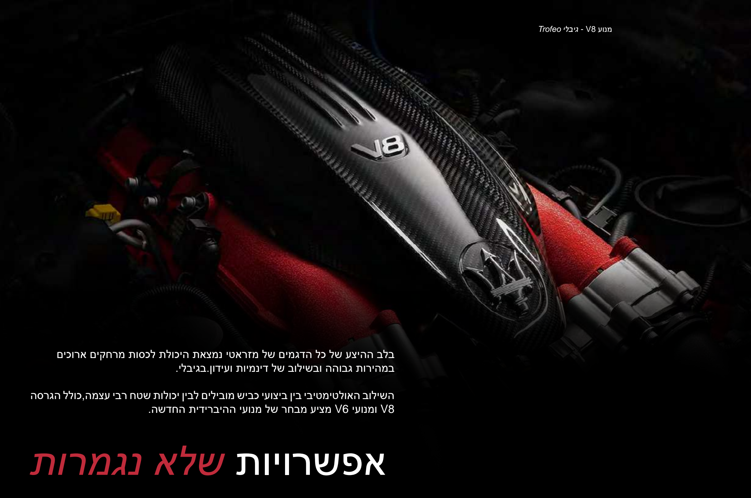
מנוע V8 - גיבלי Trofeo

בלב ההיצע של כל הדגמים של מזראטי נמצאת היכולת לכסות מרחקים ארוכים במהירות גבוהה ובשילוב של דינמיות ועידון. בגיבלי.