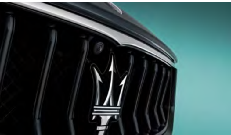
גיבלי - גריל

ללא תלות בבחירה שלכם או בשאיפות שלכם, מזראטי גיבלי תמיד מציעה תשובה מעוררת השראה ייחודית.