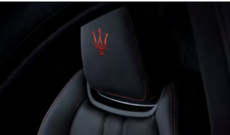
גיבלי - עיצוב משענת הראש