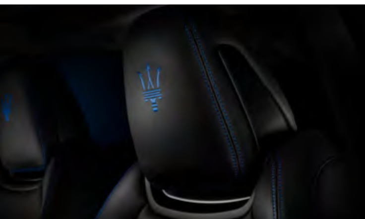
גיבלי GT Hybrid - עיצוב משענת הראש