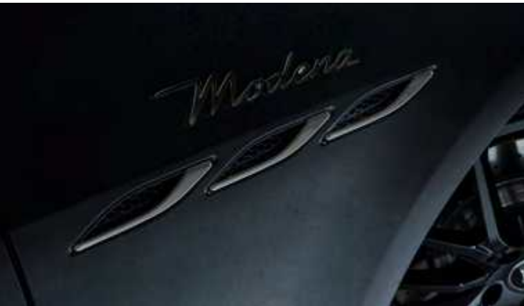
גיבלי - פתחי אוויר צידיים וסמל Modena