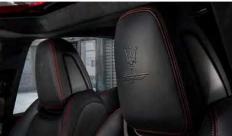
עיצוב משענת הראש - Ghibli Trofeo