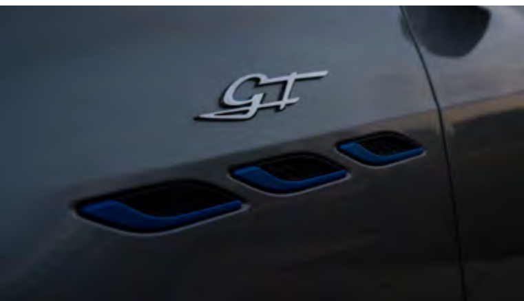
גיבלי GT Hybrid - פתחי אוויר צידיים וסמל GT