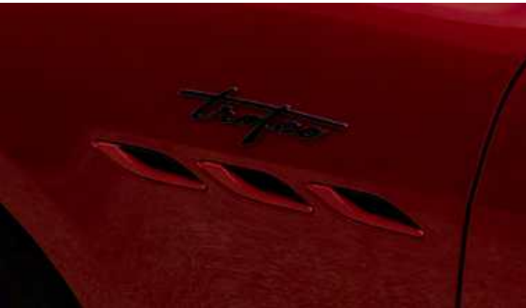
פתחי אוויר צידיים וסמל Trofeo - Ghibli Trofeo

לחיות בתעוזה. לנהוג עם אופי. לבלוט ב-4.3 שניות בלבד עם המזראטי גיבלי Trofeo האולטימטיבית. עם 580 כ"ס ומהירות מרבית של 326 קמ"ש, ה-Trofeo היא הגיבלי החזקה ביותר אי פעם. ההצהרה הנועזת שלכם המגדירה מחדש את אמנות האפשרי. מראה הקופה המרשים של הגיבלי מועצם על ידי מרכיבי עיצוב בהשראת מרוצי מכוניות. סיבי הפחמן המבריקים מלפנים, פתחי האוויר הצידיים והאחוריים עם יציאות אוויר מעניקים לכם רק Trofeo-ומכסה תא המנוע המגולף של ה טעימה ממה שמצפה לכם כשאתם אווזים בהגה שלה. כך הגיעה הגיבלי Trofeo לעולם. נולדה ממרוצים, משופרת באמצעות נוחות, עם חוש מולד ליופי אל-זמני.