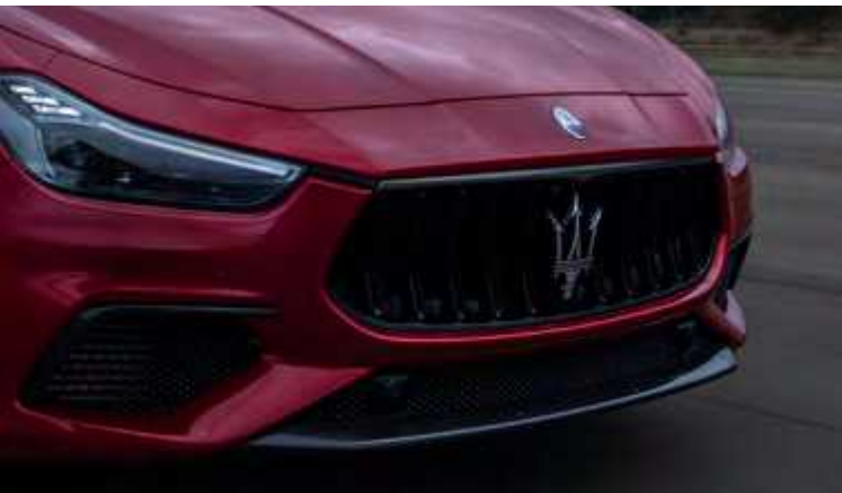
גריל - Ghibli Trofeo