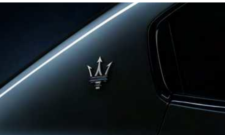
גיבלי GT Hybrid - לוגו Trident על עמוד C