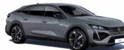
אפור כהה מטאלי SELLENIUM GREY