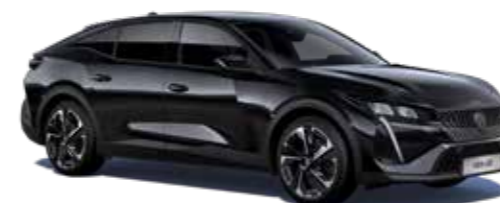
שחור מטאלי PERLA NERA BLACK