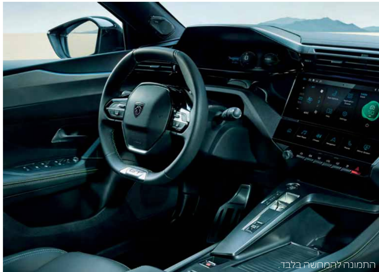
התמונה להמחשה בלבד.

ה- i-COCKPIT® של ה-408 מהווה חלק מה-DNA של פיג'ו. ה-408 מצויידת בהגה קומפקטי רב-תכליתי, לוח מחוונים שהיננו מסך בגודל 10 אינץ' הניתן להתאמה אישית ומסך מגע מרכזי בחדות גבוהה בגודל 10 אינץ'. תא הנוסעים מספק חווית נהיגה טכנולוגית ונוחה לשימוש.