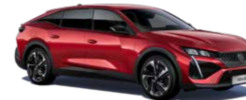
אדום מטאלי ELIXIR RED