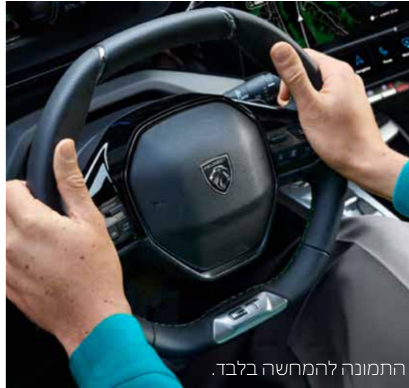
התמונה להמחשה בלבד.

בנוסף קיימת קישוריות™ ANDROID AUTO ו-APPLE CAR PLAY, גם באופן אלחוטי למכשירים תומכים.