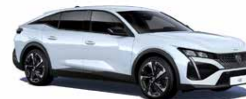
לבן מטאלי OKENITE WHITE