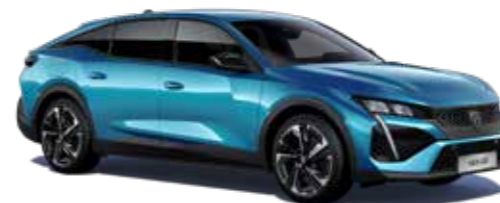
כחול בהיר מטאלי OBSESSION BLUE