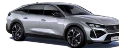
כסוף כהה מטאלי ARTENSE GREY