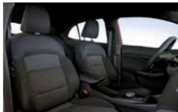
ריפוד בד לרמת גימור Comfort