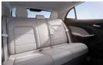
ריפוד בד בשילוב עור מלאכותי בהיר לרמת גימור Luxury