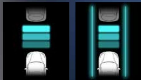
בקרת שיוט חכמה IAC בקרת שיוט אדפטיבית AAC