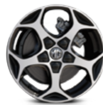
חישוק סגסוגת 16"