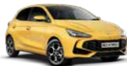
צהוב פסטל מטאלי