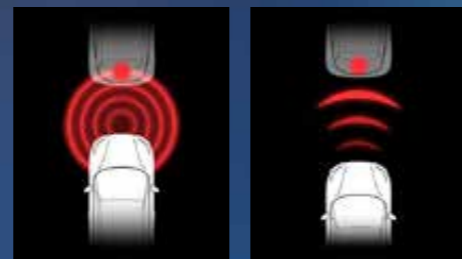
בלימת חירום אוטונומית AEB התרעה: התנגשות מלפנים