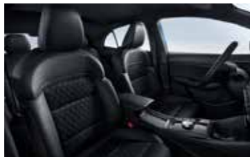
ריפוד בד משולב עור מלאכותי לרמות גימור Luxury