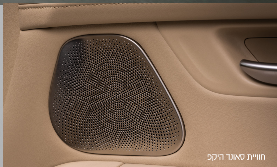
חוויית סאונד היקפ