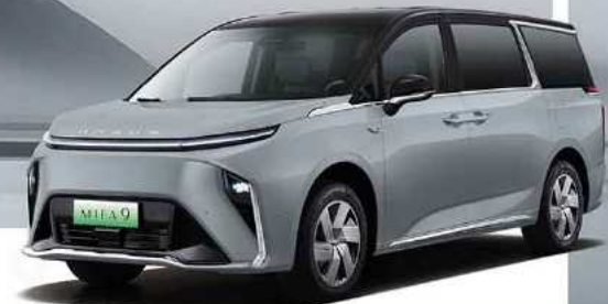
אפור בטון עם גג שחור