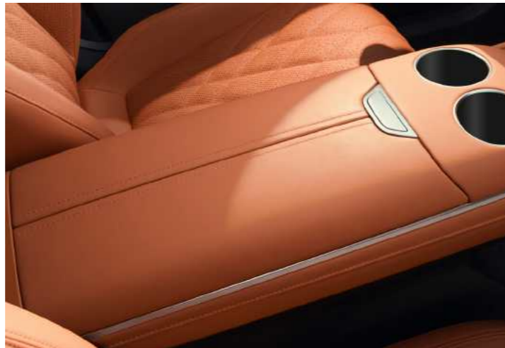
תא אחסון מקורר ליד מושב הנהג