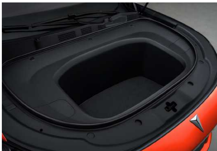
תא מטען קידמי