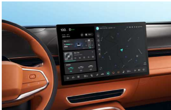
קוקפיט חכם עם מסך מסתובב 15.6" וחיווי קולי