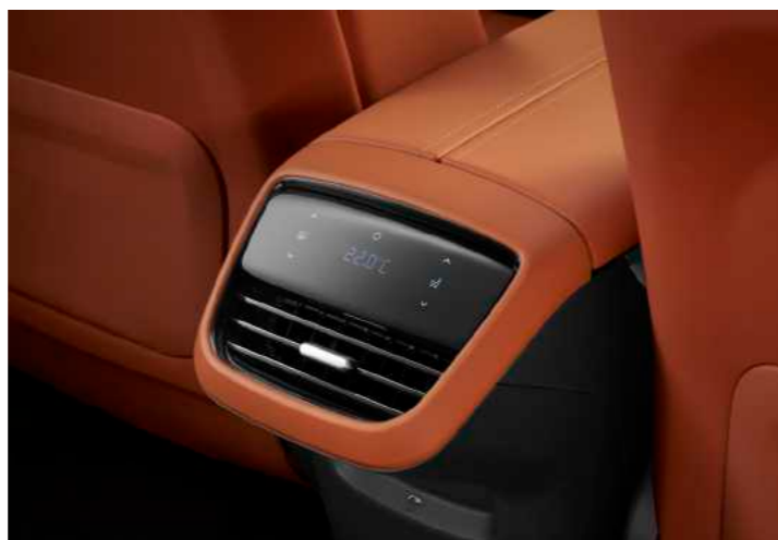
קונסולת בקרה אחורית למיזוג ושליטה במרווח הישיבה