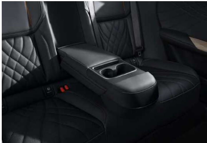
משענת יד אחורית לנוחות מירבית