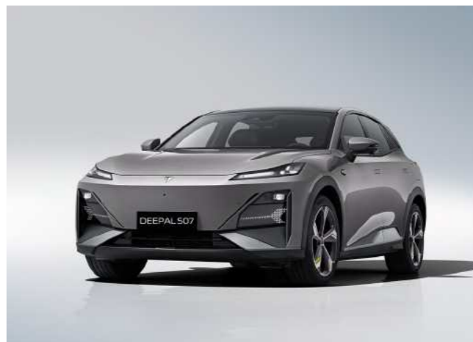
אפור כהה מטאלי