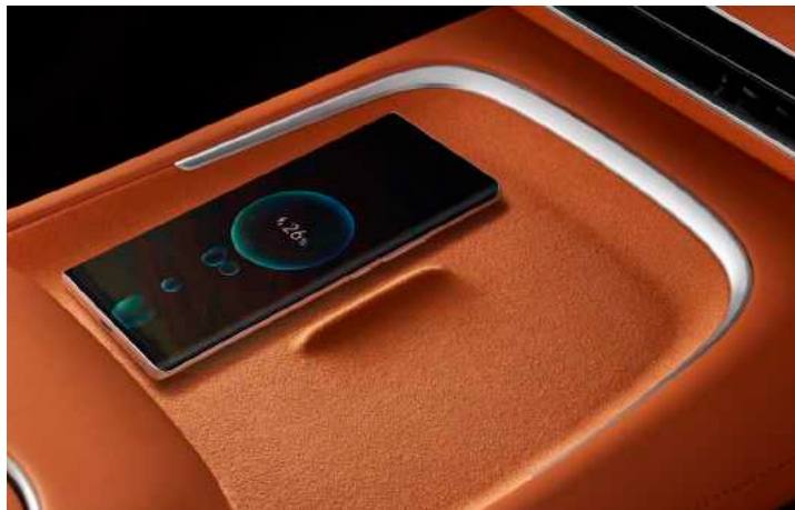
טעינת הטלפון הנייד מתבצעת על משטח טעינה אלחוטי מאוורר עם תאימות רחבה*