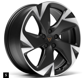
20" Hekla ENDURANCE IMMERSIVE