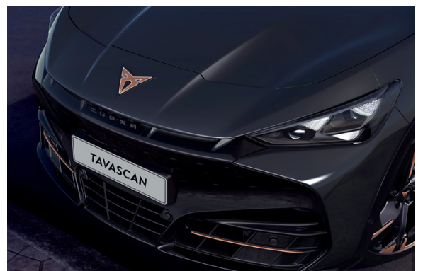
*אפור כהה 5B5B