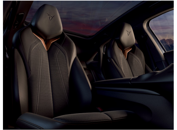
AI - DARK NIGHT