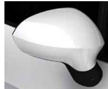
לבן נבאדה (2צ2)