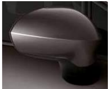
אפור פלדה (44)