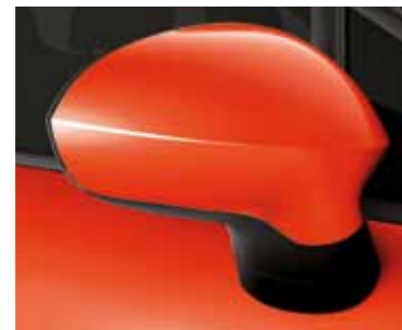
אדום בהיר (555)