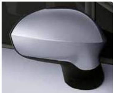
כסף תכלת (9019)