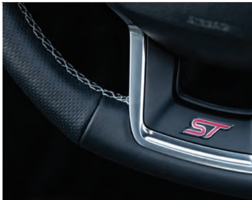
הגה מצופה עור בשילוב תפרים ייחודיים, ולוגו ST ופקדי העברת הילוכים