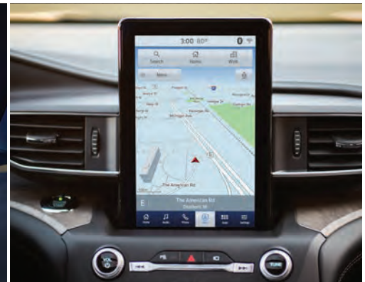
צג מגע 10.1" במרכז הקונסולה