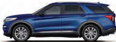
נחול אטלס (B3)