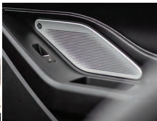
מערכת שמע B&O עם 14 רמקולים