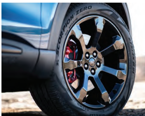
חישוקי סגסוגת קלה 21" שחורים וקאליפרים אדומים, (חבילת Street Pack)