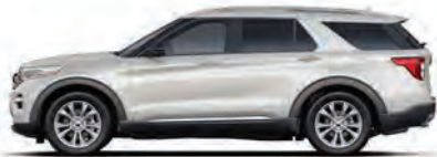
לבן נוצץ* (AZ)