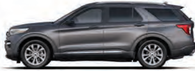
אפור קארבון (M7)