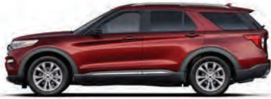
אדום מטאלי* (D4)