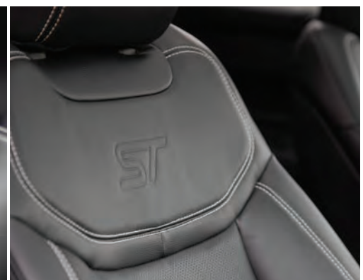
ריפודי עור בשילוב תפרים ייחודיים ולוגו ST בגון שחור