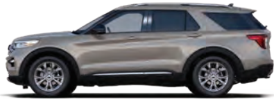
אפור אבן (D1)