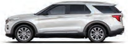
לבן (YZ) (Limited רק בדגמי Limited)