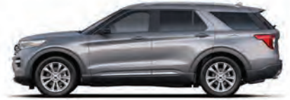
כסף אייקוני (JS)