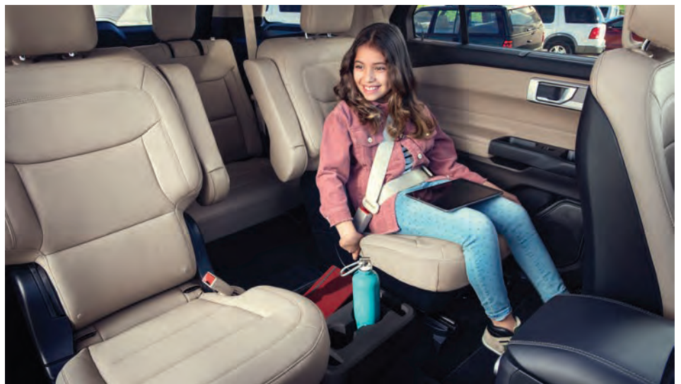
מושבי Captain בשורת המושבים השנייה, ברכב עם 6 מקומות