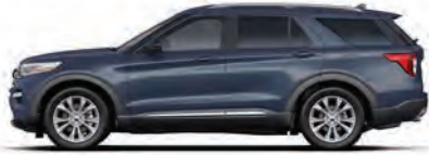
נחול כרום* (AB)