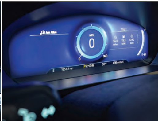
לוח מחוונים דיגיטלי 12.3"