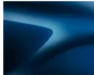
כחול מטאלי (RPR)