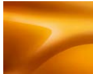
כתום מטאלי (EPY)