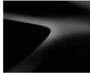
שחור פנינה מטאלי (676)