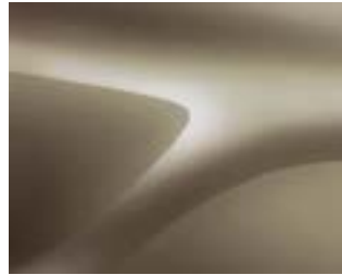
בז' מטאלי (HNP)

צבעים מטאליים תוספת בגין צבע מטאלי 1,200 ₪