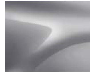
כסף מטאלי (D69)