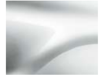
לבן קרח (369)