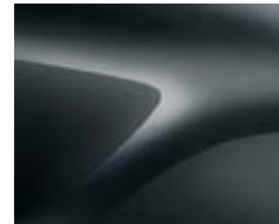
אפור מטאלי (KNA)