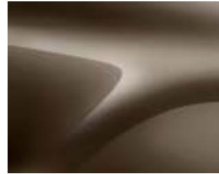
חום מטאלי (CNM)