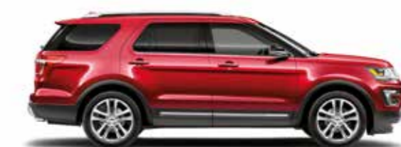
אדום לוהט מטאלי (RR)*