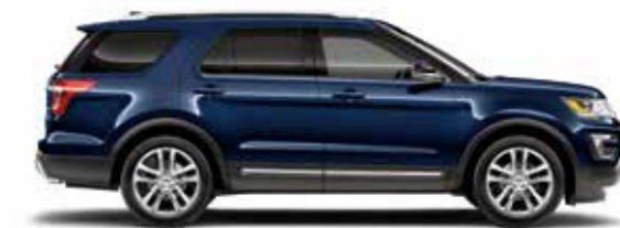
כחול ג'ינס (W)