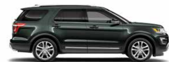
זית אפרפר (BT)