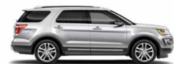
כסף מטאלי (UX)