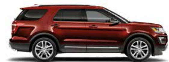
ברווזה אש (H9)*