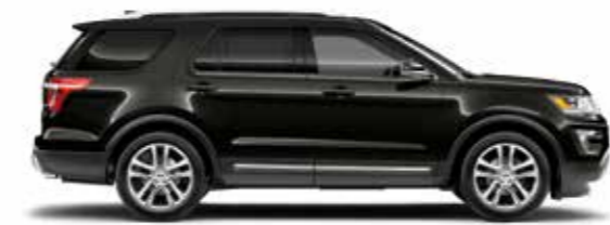
שחור צל (G)