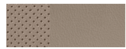
ריפוד עור מחורר בז'