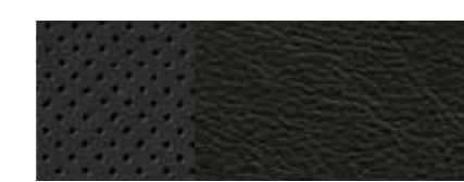
ריפוד עור מחורר שחור