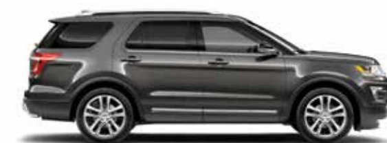
אפור מגנטי (J)