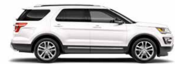
לבן פלטינה (UG)*