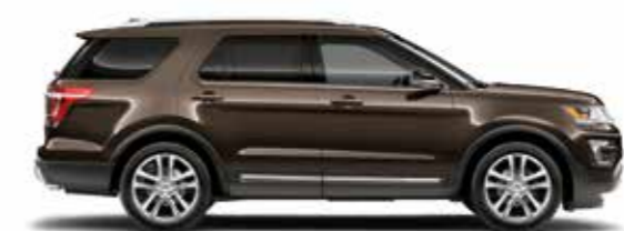
חום מטאלי (H5)