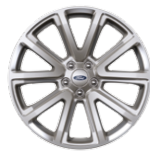
חישוק סגסוגת קלה 20"