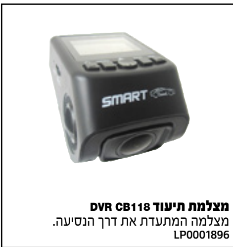
מצלמת תיעוד DVR CB118 מצלמה המתעדדת את דרך הנסיעה. LP0001896