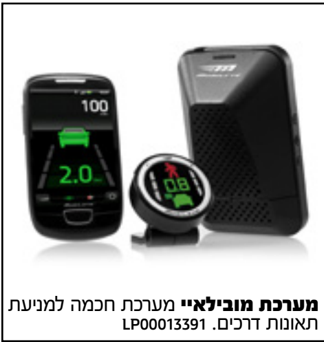
מערכת מובילאיי מערכת חכמה למניעת תאונות דרכים. LP00013391