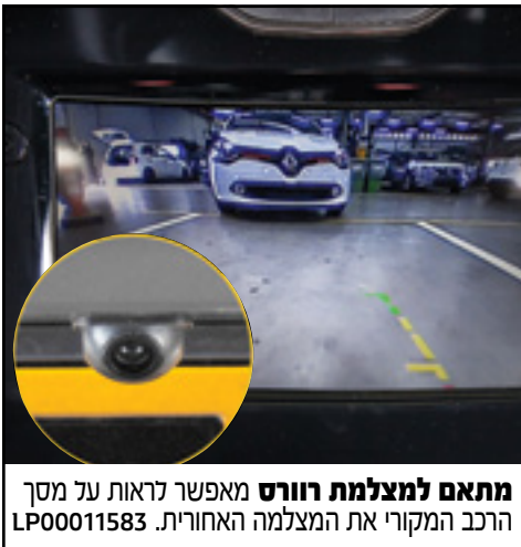
מתאם למצלמת רוורס מאפשר לראות על מסך הרכב המקורי את המצלמה האחורית. LP00011583

אתה מוזמן לאבזר את הרכב שלך ולהפוך אותו לייחודי, עם מגוון אביזרים לבחירה: