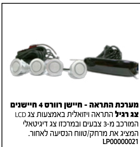
מערכת התראה - חיישן רוורס 4 חיישנים צג רגיל התראה ויזואלית באמצעות צג LCD המורכב מ-3 צבעים ובמרכזו צג דיגיטאלי המציג את מרחק/טווח הנסיעה לאחור. LP00000021