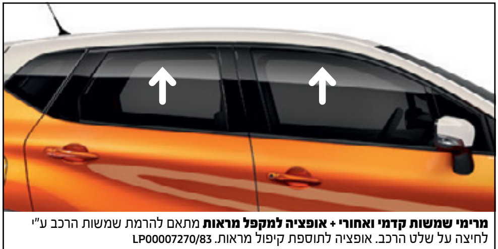
מרימי שמשות קדמי ואחורי + אופציה למקפל מראות מתאם להרמת שמשות הרכב ע"י לחיצה על שלט הרכב. אופציה לתוספת קיפול מראות. LP00007270/83