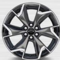
SP4 20" (RS)