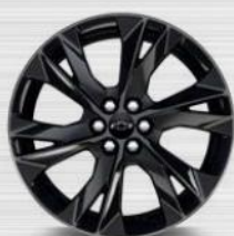
RQM 21" (RS) *בתוספת תשלום