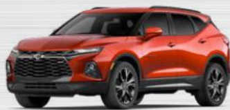
כתום מטאלי (GLL) ב-RS בלבד | *בתוספת תשלום