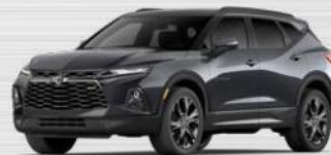
אפור כהה מטאלי (GIV)