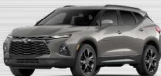
אפור פיוטר מטאלי (GFR)