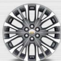
SP5 20" (PREMIER)