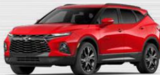
אדום לוהט (G7C) ב-RS בלבד