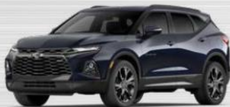
כחול כהה מטאלי (GLU)