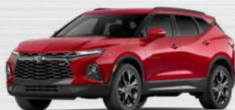
אדום דובדבן מטאלי (GSK) *בתוספת תשלום