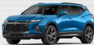
כחול לגונה מטאלי (GLT) ב-RS בלבד