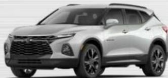
כסף מטאלי (GAN)