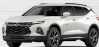
לבן פנינה (G1W) *בתוספת תשלום