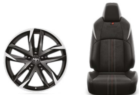
חישוקי סגסוגת קלה 19" עם ריפוד אלקנטרה מושבים ספורטיביים