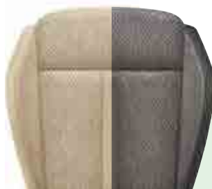
CB/BG רמת גימור Style