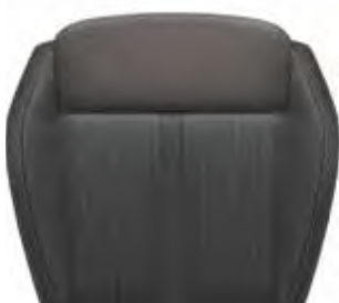
AH רמת גימור Dynamic