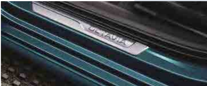
ספי דלתות מעוצבים