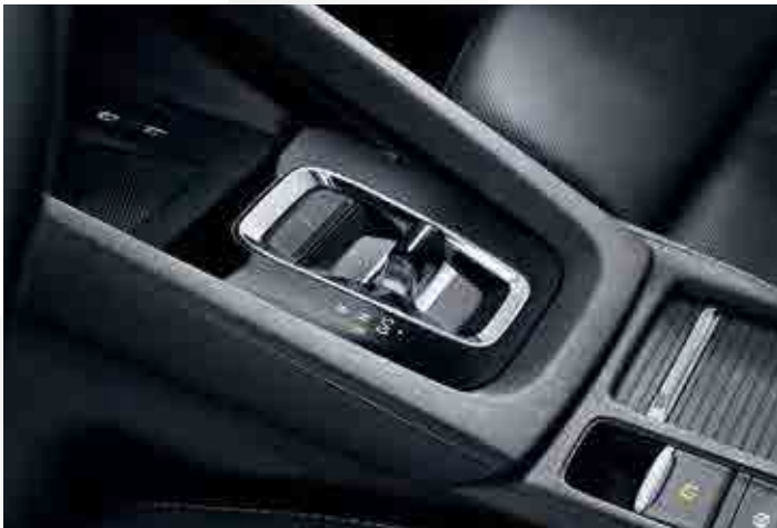
בלם יד חשמלי ו-Shift by wire

עוגנים למושב בטיחות לילדים, כולל במושב הנסע הקדמי