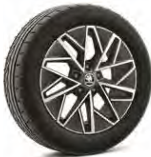
רמת גימור Dynamic 17"