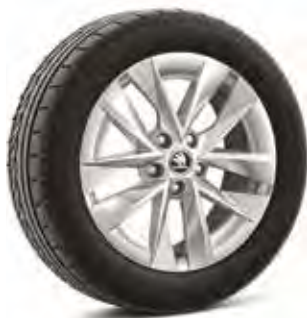
רמת גימור Ambition 17"