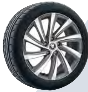
רמת גימור Style 18"