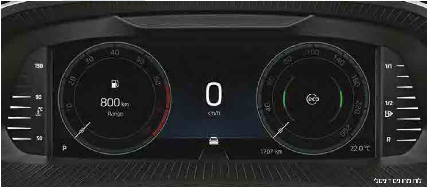
לוח מחוונים דיגיטלי