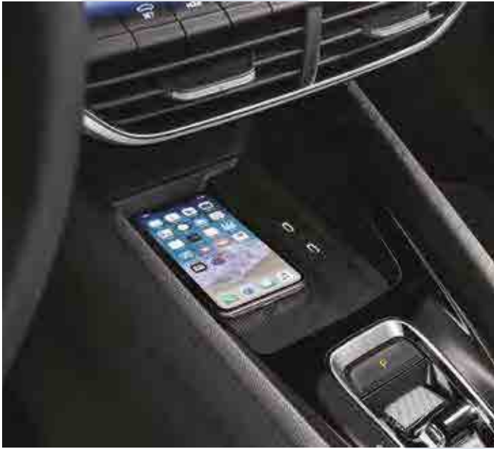
תא ייעודי לטלפון הנייד עם טעינה אלחוטית