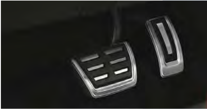
דושות בחיפוי דמוי אלומיניום