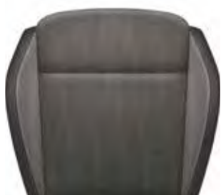
BG רמת גימור Ambition