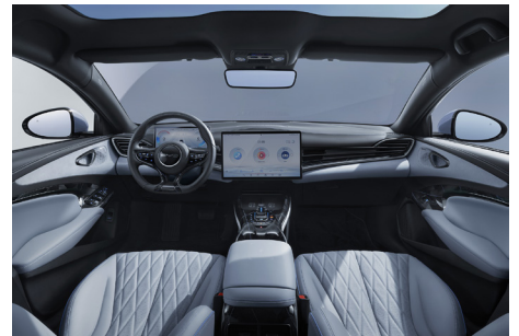
Tahiti blue (O7)