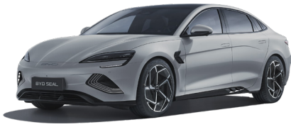
*Indigo Grey (INDI) *צבע בתוספת תשלום*

צבעים חיצוניים ברמות גימור Excellence-AWD-1 Design