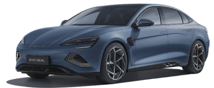
Atlantis Grey (GREY)

צבעי פנים ברמות גימור Excellence-AWD-1 Design