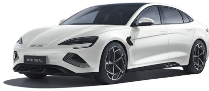
Polar White (WHIT)