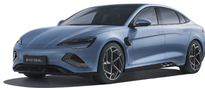
Ice Blue (BLUE)