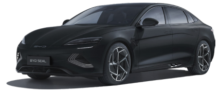
Space Black (BLAC)