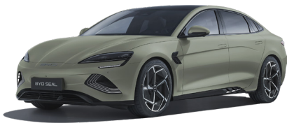
*Shadow Green (GREN) *צבע בתוספת תשלום*