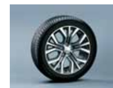
חישוקי סגסוגת 18"