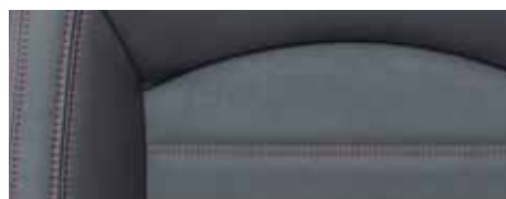
מושבי Grand Lux (R) עם תפרים אדומים*