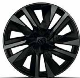
חישוקי סגסוגת 18" EVISSA GT