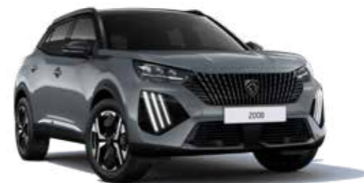
אפור כהה מטאלי SELENIUM GREY