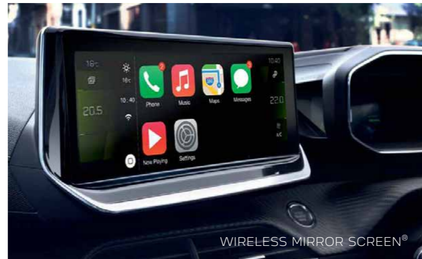
WIRELESS MIRROR SCREEN®