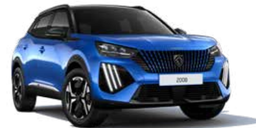
כחול פנינה מטאלי VERTIGO BLUE