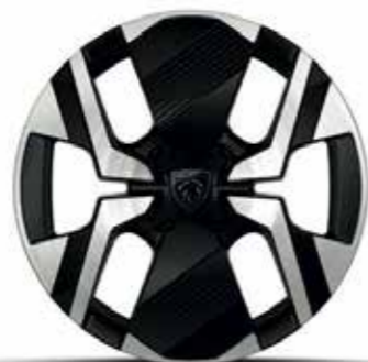
חישוקי סגסוגת 17" KARAKOY ALLURE