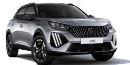
כסוף כהה מטאלי ARTENSE GREY