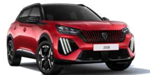
אדום מטאלי ELIXIR RED