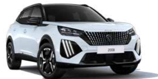
לבן מטאלי OKENITE WHITE