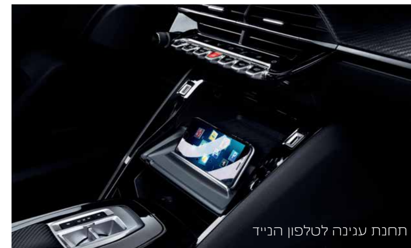
תחנת עגינה לטלפון הנייד

חברו את הטלפון הנייד שלכם בצורה אלחוטית (למכשירים תומכים בלבד), דרך APPLE CARPLAY™ או ANDROID AUTO ותוכלו לשלוט באפליקציות העיקריות שלכם, כגון: טלפון, ניווט, שיחות קוליות והודעות טקסט.