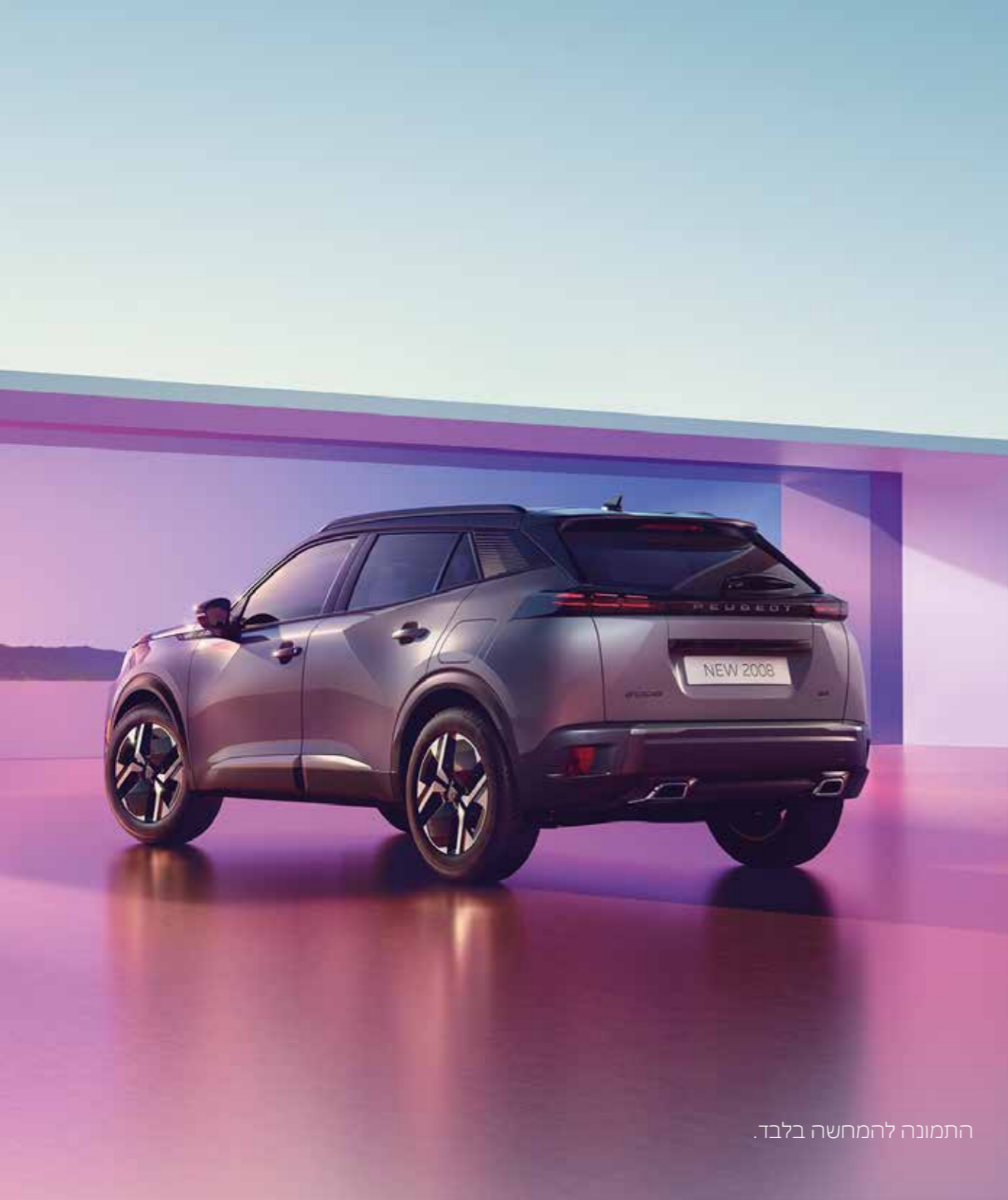
התמונה להמחשה בלבד.