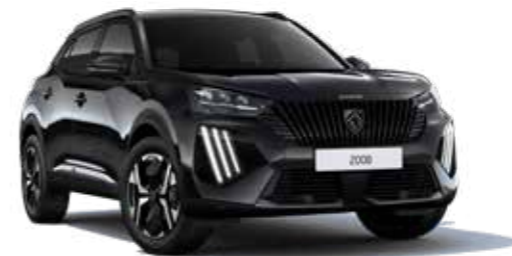
שחור מטאלי NERA BLACK