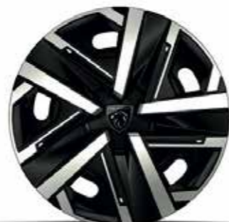
חישוקי סגסוגת 16" SILOM ACTIVE