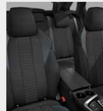
ACTIVE PACK ריפוד בד בצבע אפור כהה (בהתאם לזמינות המלאי)