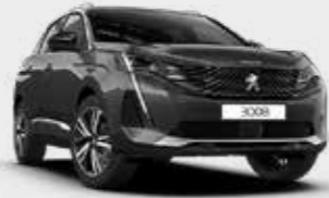
אפור כהה מטאלי PLATINIUM GREY | VLM0