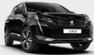
שחור מטאלי BLACK PERLA | 9VM0

לרשותך עומד מגוון רחב של צבעים שיאפשר לך להביע את עצמך באופן מלא.