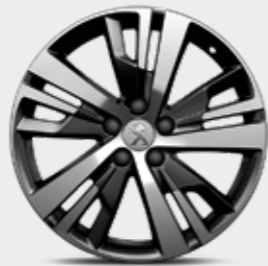
חישוקי סגסוגת 18"

*צבע מטאלי בתוספת תשלום (למעט כחול בהיר)