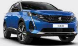
כחול פנינה מטאלי VERTIGO BLUE | SMM6

*צבע מטאלי בתוספת תשלום (למעט כחול בהיר)