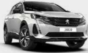
לבן פנינה מטאלי PEARLESCENT WHITE | N9M6