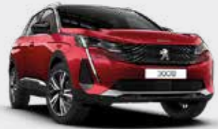
אדום מטאלי ULTIMATE RED | F3M5