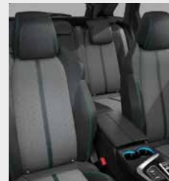
PREMIUM ריפוד בד בצבע אפור בהיר בשילוב דמוי עור