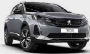
כסוף כהה מטאלי ARTENSE GREY | F4M0