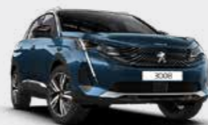
כחול בהיר מטאלי CELEBES BLUE | SYM0