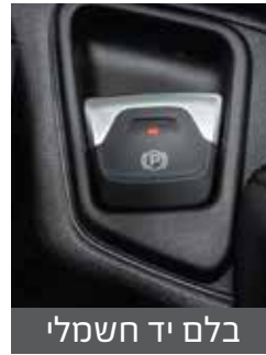
בלם יד חשמלי