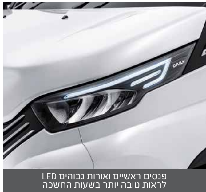
פנסים ראשיים ואורות גבוהים LED לראות טובה יותר בשעות החשכה