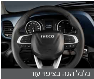
גלגל הגה בציפוי עור