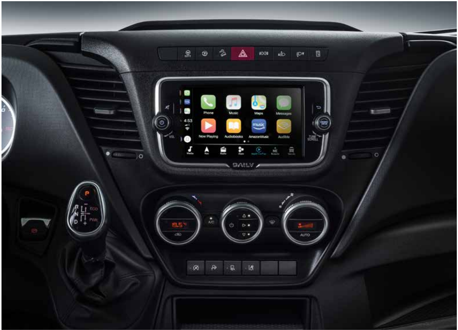
מולטימדיה מקורית בעברית עם מסך 7 אינץ' הכוללת שיקוף של הטלפון ומצלמת נסיעה לאחור