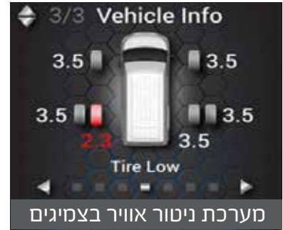
מערכת ניטור אוויר בצמיגים