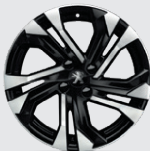
SALAMANCA 17" חישוקי סגסוגת PREMIUM/GT Line בדגמי