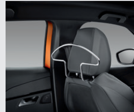
סט קולבים למשענות הראש הקדמיות