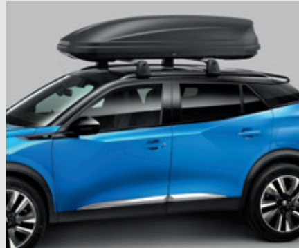
מגוון תאי אחסון עילאיים לבחירה