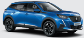
VERTIGO BLUE | SMM6 | כחול פנינה מטאלי