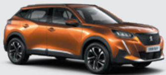
ORANGE FUSION | 2SM0 | כתום מטאלי