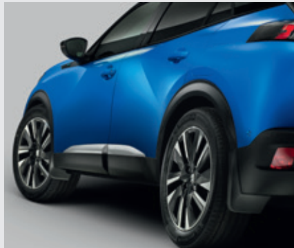
סט מגני בוץ (קדמיים + אחוריים)