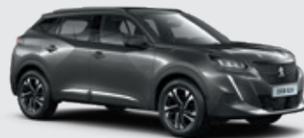
PLATINIUM GREY | VLM0 | אפור כהה מטאלי