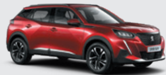
ELIXIR RED | VHM5 | אדום מטאלי