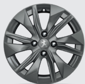
ELBORN 16" חישוקי סגסוגת ACTIVE בדגמי