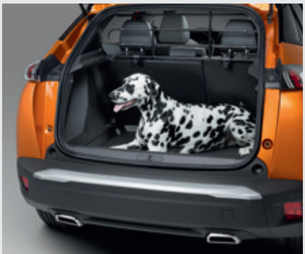
גריל הפרדה לתא מטען