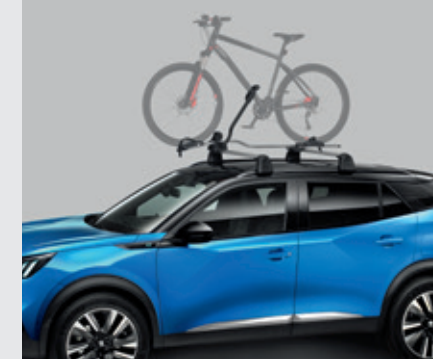
מנשא לאופניים (נדרש מוטות רחב)