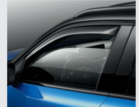
סט מסיטי רוח לחלונות הקדמיים