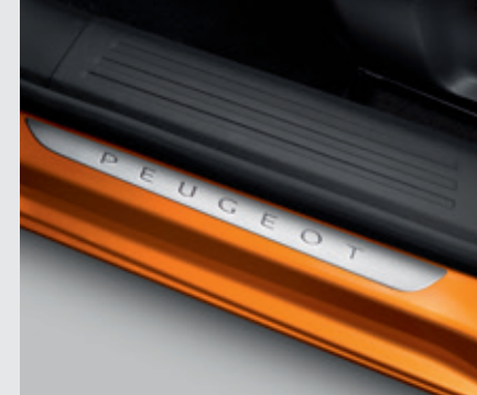
סט ספי דלת