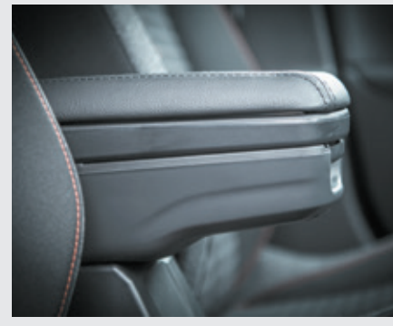
משענת יד אמצעית*