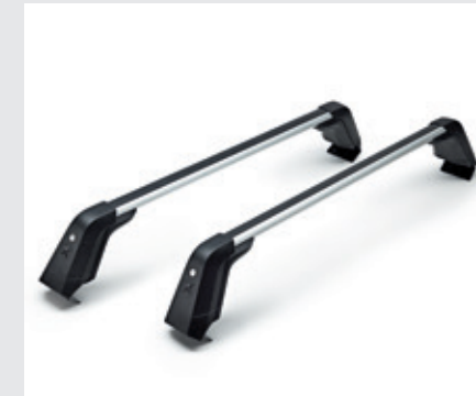
מוטות רחב (על גג הרכב)