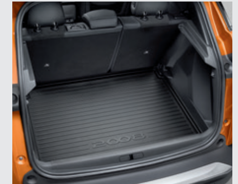
משטח פלסטיק לתא מטען