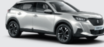
PEARLESCENT WHITE | N9M6 | לבן פנינה מטאלי