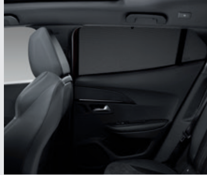
סט רשתות הצללה*