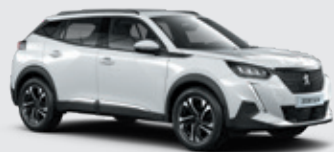
BANQUISE | WPP0 | לבן בנקיז