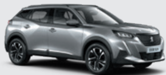
ARTENSE GREY | F4M0 | כסוף כהה מטאלי