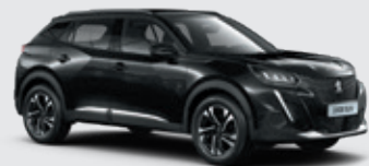
ONYX BLACK | XYP0 | שחור