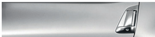
K23 כסף מטאלי