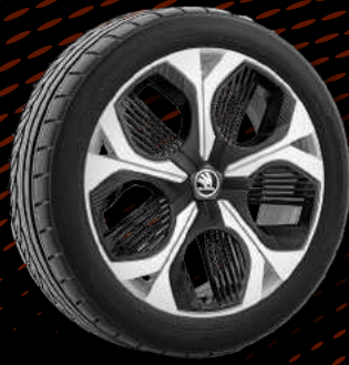
חישוקי סנסונת RS בגודל 19"