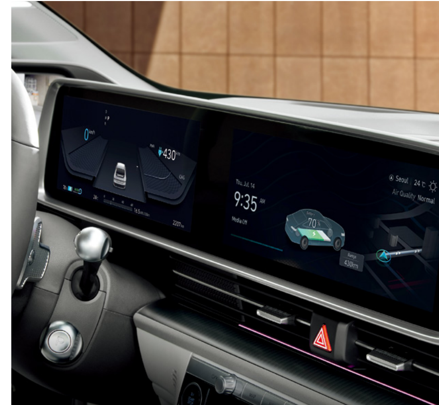
תצוגה רחבה אינטגרלית

לנוחות הנוסעים מאחור, פתחי מיזוג אוויר למושב האחורי בשילוב שני שקעי USB type C.