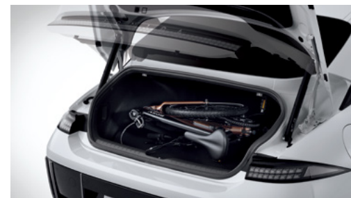
דלת תא מטען חשמלית