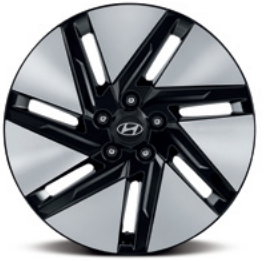
חישוקי סגסוגת בקוטר 18"