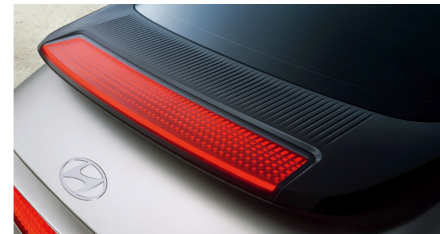
תאורת בלם אחורי בעיצוב פיקסל