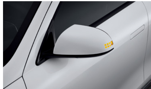
איתות במראות צד