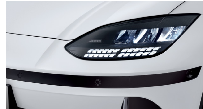
פנסים קדמיים מסוג LED בעיצוב פיקסלים