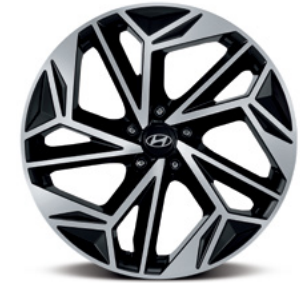
חישוקי סגסוגת בקוטר 20"