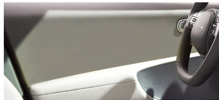
דלת חלקה ללא כפתורים

הכפתורים עברו מהדלתות הקדמיות אל הקונסולה המרכזית כדי להגדיל את החלל ואת מקום האחסון.