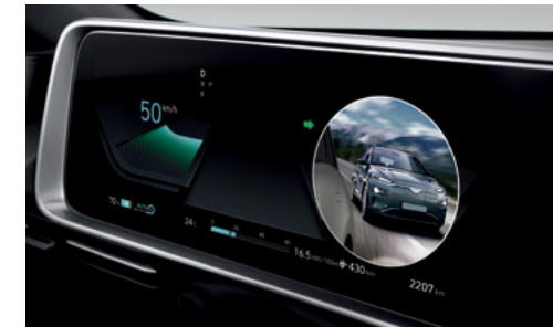
הצגת צילום חי של "שטח מת" על גבי לוח המחוונים הדיגיטלי בעת הפעלת איתות (BVM)*