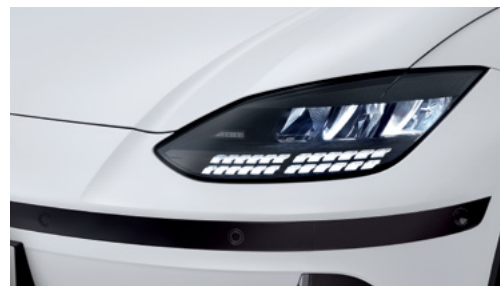
פנסים ראשיים + תאורת יום LED