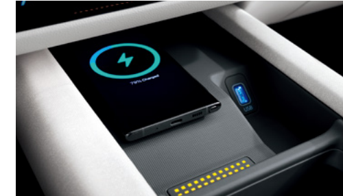
טעינה אלחוטית לנייד (למכשירים תומכים בטכנולוגיה לפי תקן טעינה qi)