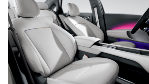
מושבים קדמיים מתכווננים הניתנים להטיה מלאה*