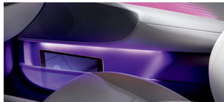
תאי אחסון שקופים בדלתות