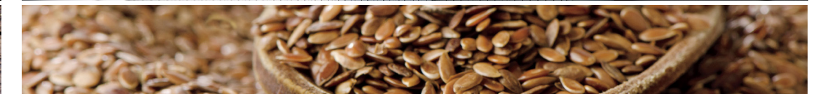
עור שעבר עיבוד ידידותי לסביבה* העור המשמש לייצור המושבים עבר תהליך עיבוד ידידותי לסביבה על ידי שימוש בשמן מזרעי פשתן.