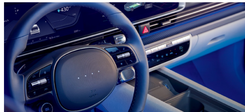
תאורת LED משתנה

חלל הפנים העוטר של ה-IONIQ 6 הוא מקום נעים, נוח ומרווח המתמקד באנשים שנמצאים בו.