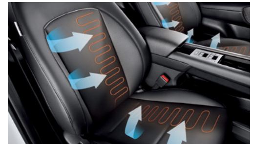
חימום מושבים קדמיים