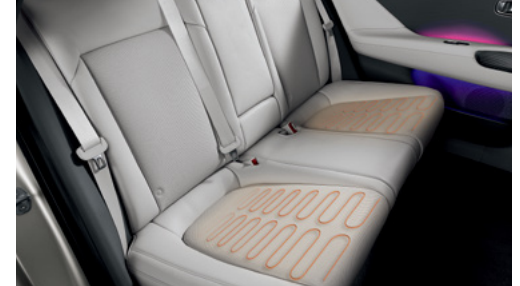
חימום מושבים אחוריים*