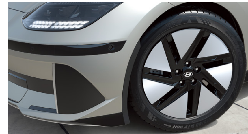
חישוקי סגסוגת בקוטר 18*