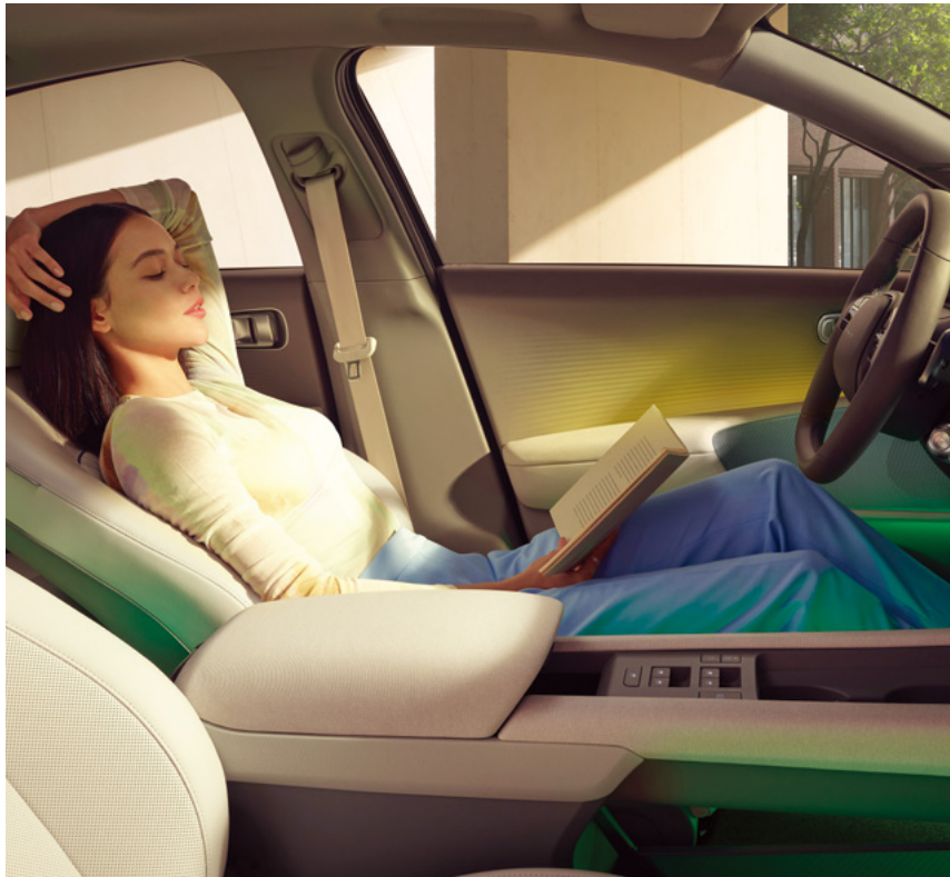
מושבים קדמיים מתכוננים הניתנים להטיה מלאה (Relaxation Comfort Seat)**

גלו את המגוון הרחב של מאפייני הנוחות ב-6 IONIQ.