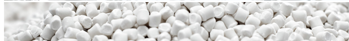
תקרת בד BIO-PET החומר המשמש לייצור התקרה מגיע מסיבים ידידותיים לסביבה המיוצרים מקני סוכר.