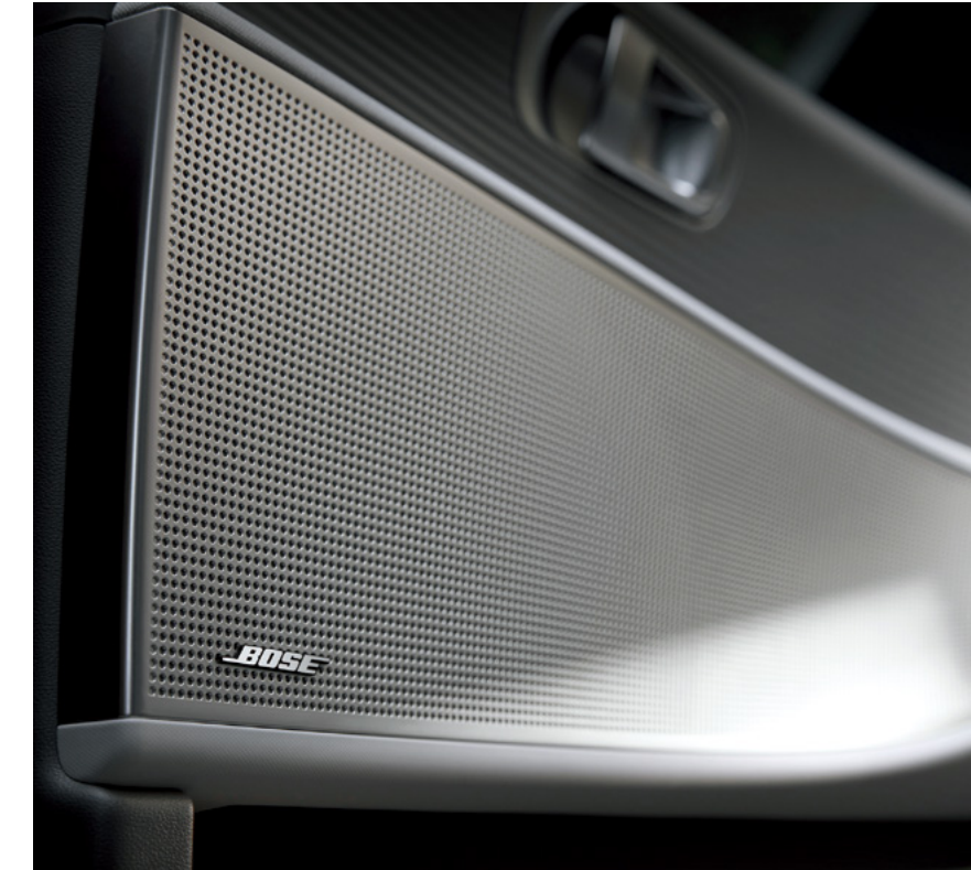
מערכת שמע יוקרתית מבית Bose*

לוח מחוונים בגודל 12.25" ומערכת מולטימדיה גם היא בגודל 12.25" יוצרים יחד מסך אחד רחב המספק גישה מהירה לכל המידע החיוני. כל מה שאתם צריכים, נמצא ממש בקצות אצבעותיכם.