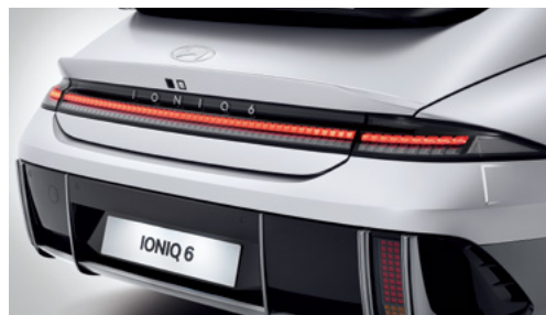
פנסים אחוריים בתאורת LED