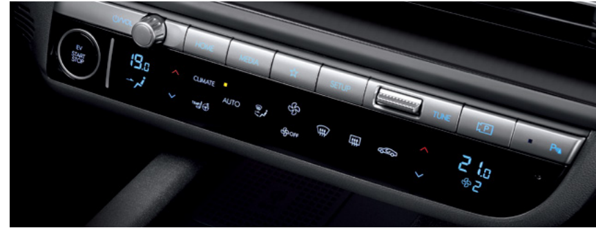
מערכת בקרת אקלים דיגיטלית מכוזלת

מערכת בקרת האקלים מצוידת במערכת דו-אזורית המאפשרת שליטה מדויקת בטמפרטורה.