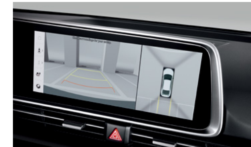
מערך 4 מצלמות היקפי (AVM)*