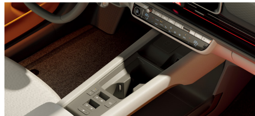
קונסולה מרכזית צפה

תאורה אינטראקטיבית על גלגל ההגה הכוללת 4 נורות LED המציגה את חיוויי הטעינה של הסוללה ומצבי הנהיגה השונים.