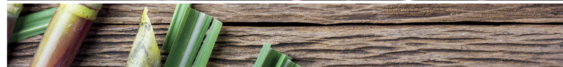
דשבורד BIO-TPO תרכובת ייחודית המכילה רכיבים טבעיים ועושה שימוש בסיבי קני סוכר המשמשת ליצירת דשבורד מודרני, איכותי וידידותי לסביבה.