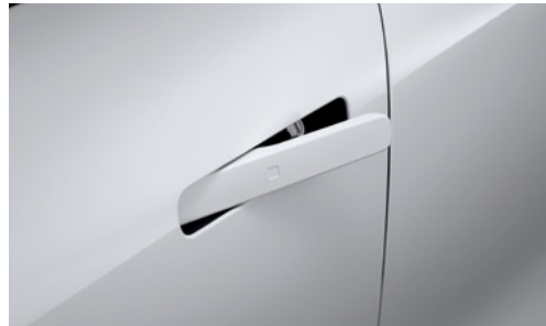
ידיות דלתות שטוחות