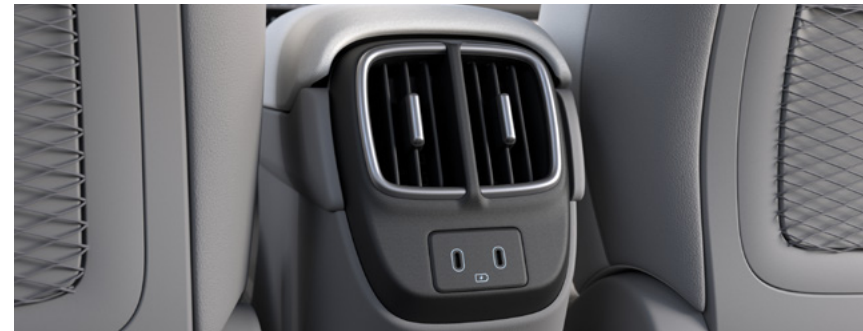
פתחי מיזוג אוויר למושב האחורי

מערכת בקרת האקלים מצוידת במערכת דו-אזורית המאפשרת שליטה מדויקת בטמפרטורה.