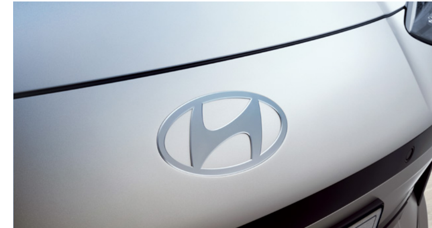
מכסה מנוע שטוח וסמל יונדאי בעיצוב חדש