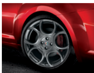
73Z חישוקי 18"

המפרט הטכני אינו סופי וייתכנו בו שינויים בהתאם להוראות היצרן ו/או החלטות החברה. המפרט נועד להמחשה בלבד ואינו מחייב את החברה ו/או את היצרן. המפרט הטכני הסופי יינתן ללקוח בהתאם לבקשתו לפני קבלת הרכב.