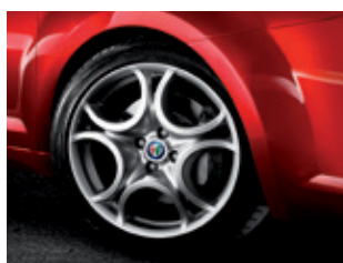
431 חישוקי 17"