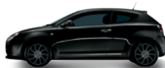
601 שחור אלגנטי