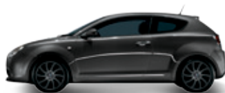
607 אפור גרפיטי