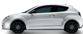
268 לבן אלפא