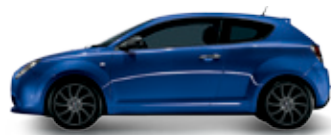
468 כחול טורנדו