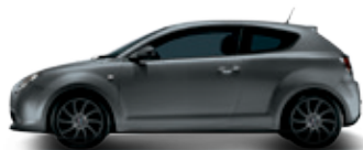
529 אפור מגנזיום מט