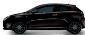
805 שחור אטנה