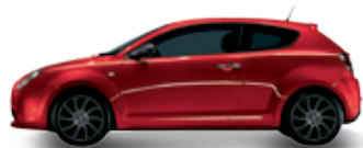
289 אדום קופידון