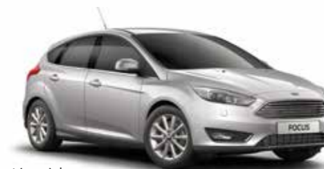
כסף מטאלי (COO)*