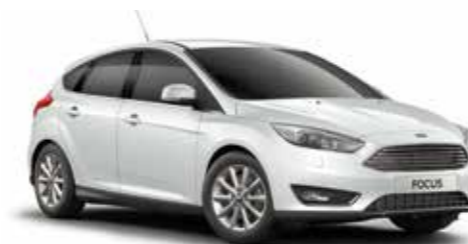
לבן קפוא (CO5)