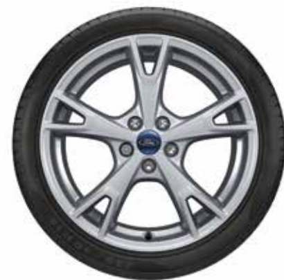
חישוק סגסוגת קלה ("מגנזיום") 18" ברמת גימור Titanium