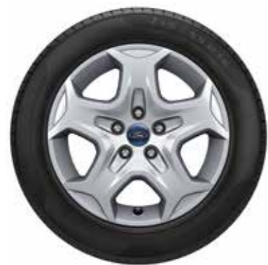
חישוק פלדה 16" ברמת גימור Trend