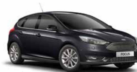
שחור אבסולוטי (COI)*