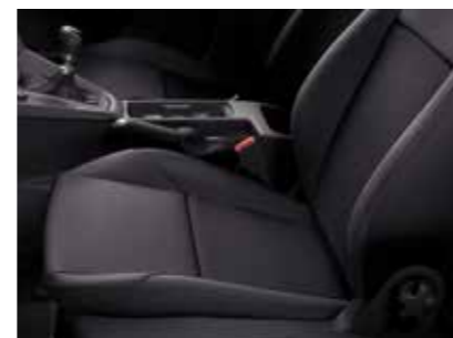
בד שחור ברמת גימור Trend

לתשומת ליבך! דוגמאות הצבעים והריפודים בקטלוג זה מוצגות לשם המחשה בלבד. בשל מגבלות הדפוס, תתכנה סטיות מהצבעים והחומרים בפועל. היצע הצבעים, החומרים והחישוקים כפוף לשינויים אפשריים על פי מדיניות היצרן ולמגבלות המלאי. פנה לנציג מכירות לקבלת מידע עדכני.