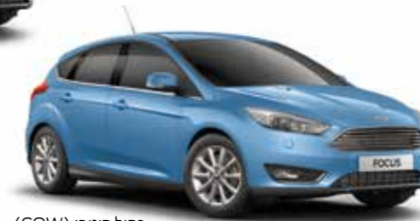
כחול קוטבי (COW)