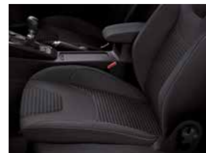
בד מהודר שחור ברמת גימור Titanium