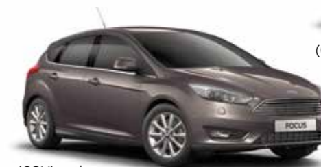
אפור לונגר (COV)