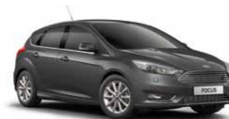
אפור מגנטי (COB)