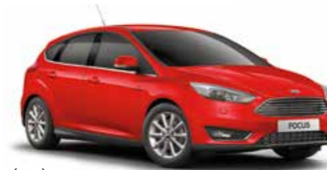
אדום מרוצים (COZ)