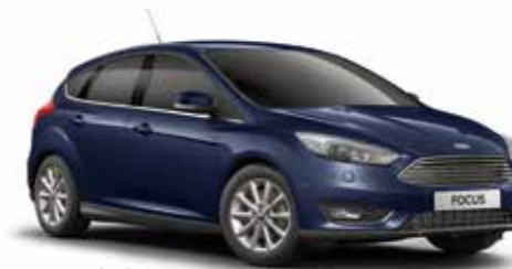
כחול בלייזר (COR)