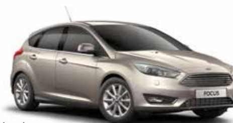
כסף טקטוני (COA)