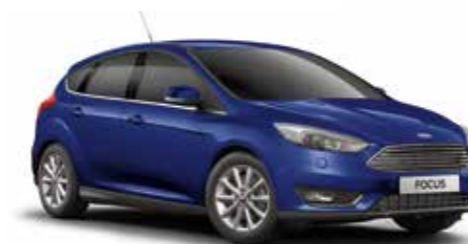
כחול מטאלי (COH)*

לתשומת ליבך! דוגמאות הצבעים והריפודים בקטלוג זה מוצגות לשם המחשה בלבד. בשל מגבלות הדפוס, תתכנה סטיות מהצבעים והחומרים בפועל. היצע הצבעים, החומרים והחישוקים כפוף לשינויים אפשריים על פי מדיניות היצרן ולמגבלות המלאי. פנה לנציג מכירות לקבלת מידע עדכני.