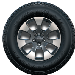
חישוקי 18" Sahara