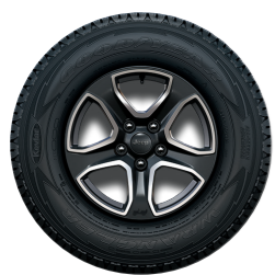
חישוקי 17" Sport