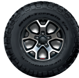
חישוקי 17" Rubicon