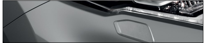
KAD אפור מטאלי