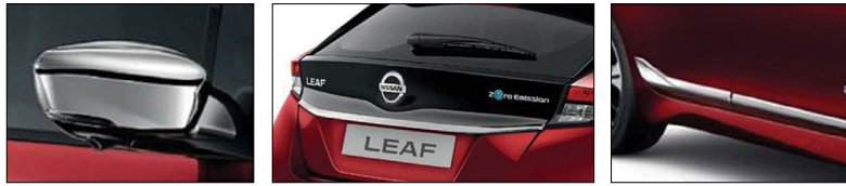
החבילה כוללת (מקורי): קישוט ניקל לדלתות, כיסוי מראות ניקל, קישוט ניקל לדלת תא מטען.