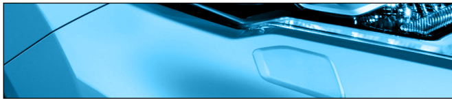
RCA כחול קריביים