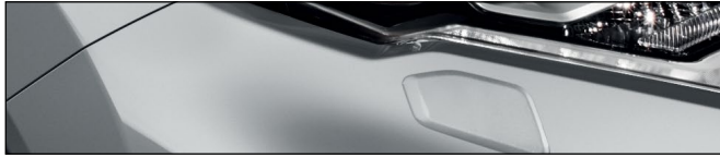
KYO כסף מטאלי