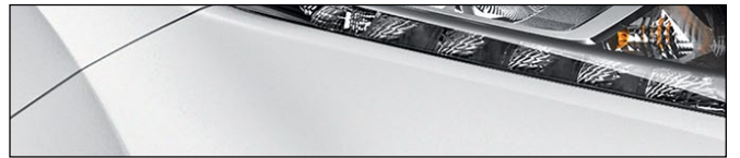
QAB לבן פנינה מטאלי