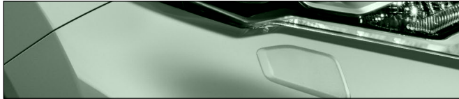
KBR אפור MINT