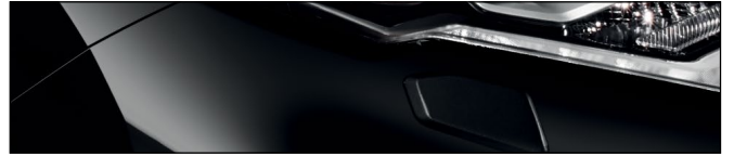
Z11 שחור מטאלי