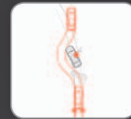
ABS & EBD

הנוסעים ברכב מוגנים על ידי 7 כריות אוויר, הכוללות גם כרית אוויר אחת לברכי הנהג, המפחיתה באורח ניכר תנועה קדימה. חגורות בטיחות קדמיות עם קדם מותחן, מרתקות את הגוף למושב ומפחיתות את עצמת המכה המועברת לנוסעים. הגנה נוספת מוענקת על ידי מרכב הבנוי בטכנולוגיית RISE, אשר מפחית את עוצמת הזעזוע המועבר לנוסעים בזמן תאונה.