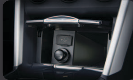
שקע USB בקונסולה המרכזית