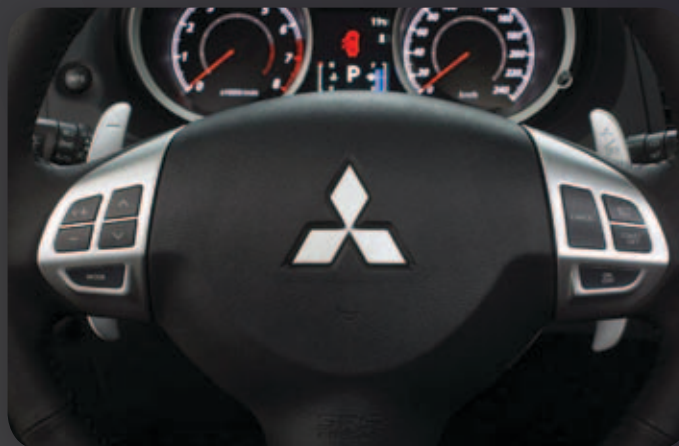
מנופי העברת הילוכים מגלגל ההגה