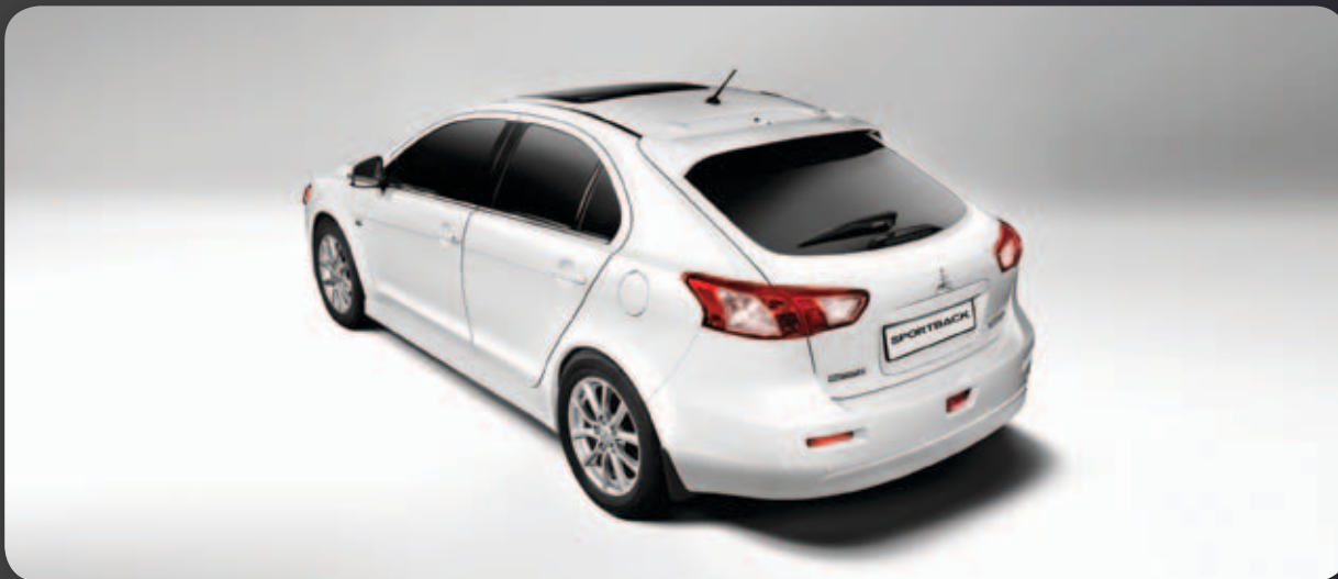
גג שמש חשמלי