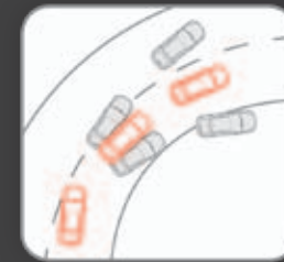
ASC & TCL

ספורטבק מצויד בשלל מערכות בטיחות אקטיביות, המיועדות להגן על הנוסעים ולמנוע מצבי חירום טרם התהוותם. לספורטבק מערכת בקרת יציבות אקטיבית (ASC) ומערכת בקרת משיכה (TCL), המונעות מהרכב לאבד אחיזה ויציבות. בנוסף לספורטבק מערכת למניעת נעילת גלגלים בבלימה (ABS) ומערכת אלקטרונית לחלוקת עצמת בלימה (EBD) וסייען בלימה (BAS), אשר מגביר את עצמת הבלימה ומקצר את מרחק הבלימה במצבי חרום.