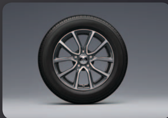
חישוקי סגסוגת קלה