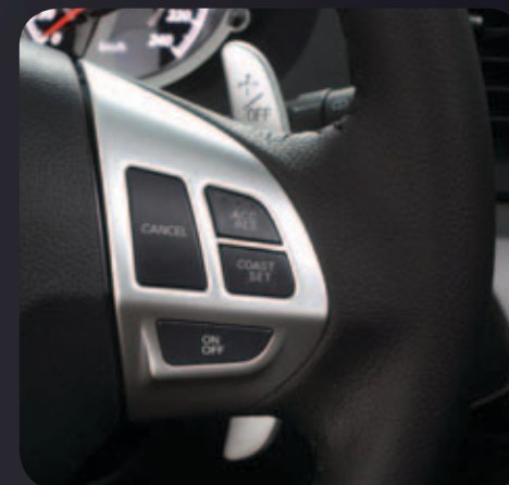
תפעול בקרת שיוט (CRUISE CONTROL) מגלגל ההגה.