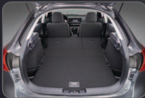
קיפול מלא של המושבים

מאחורי החיצוניות הספורטיבית ספורטבק מצויד בתא נוסעים מרווח, המסוגל לארח חמישה נוסעים בנוחות רבה. בחלקו האחורי מושב תומך לשלושה נוסעים, אשר מתקפל כולו או בחלקו (60:40), במשיכת ידיים מתא המטען כדי ליצור משטח העמסה שטוח, מרווח ונוח. תא נסתר מתחת לרצפת תא המטען מאפשר לאחסן בנוחות עוד פריטים הכרחיים.