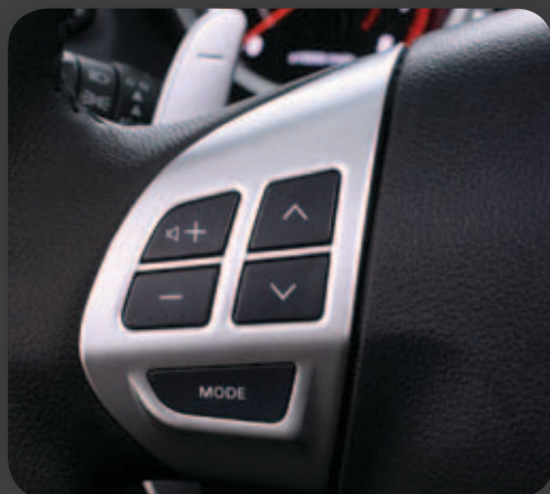
שליטה על מערכת השמע מגלגל ההגה