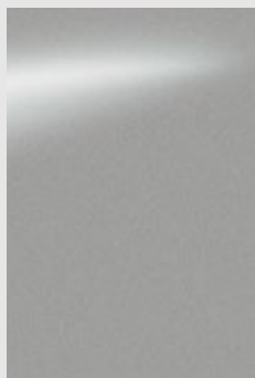
KL0 כסף מטאלי