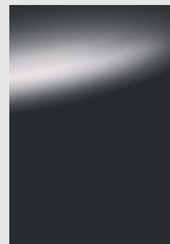
K51 אפור מטאלי