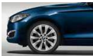
חישוקי סגסוגת קלה 18" דגם V-spoke style 387