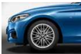
חישוקי סגסוגת קלה 17" דגם Double-spoke style 724