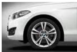
חישוקי סגסוגת קלה 18" דגם Double-spoke style 385