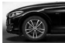
חישוקי סגסוגת קלה 17" דגם Double-spoke style 725