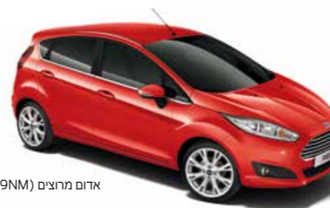
אדום מרוצים (9NM)

לתשומת ליבך! דוגמאות הצבעים והריפודים בקטלוג זה מוצגות לשם המחשה בלבד. בשל מגבלות הדפוס, תכנה סטיות מצבעי המכוניות ובדי הריפוד בפועל. היצע הצבעים, בדי הריפוד והחישוקים כפוף לשינויים אפשריים על פי מדיניות היצרן ולמגבלות המלאי. פנה לנציג מכירות לקבלת מידע עדכני.