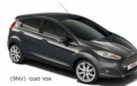
אפור מגנטי (9NV)