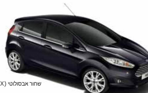
שחור אבסולוטי (9NX)