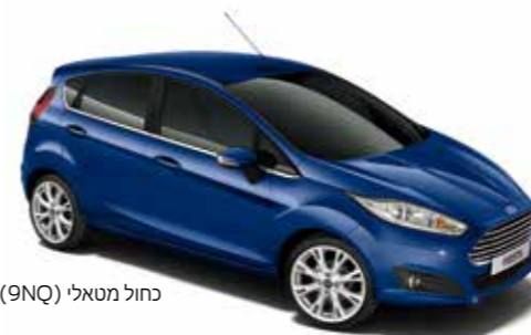
כחול מטאלי (9NQ)