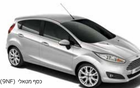
כסף מטאלי (9NF)