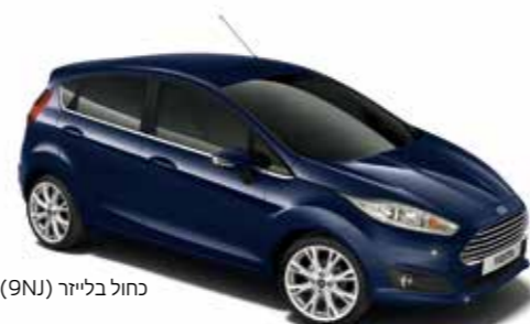
כחול בליזר (9NJ)