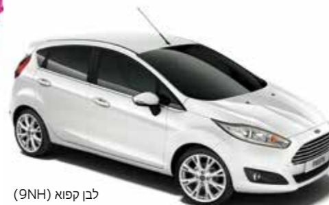
לבן קפוא (9NH)